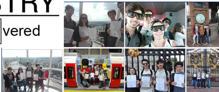
Víťazi prvého Chemistry Rediscovered v roku 2016 z Portugalska, na víťaznom výlete v Londýne!

Pridajte sa k nám v budúcom roku pri oslave jednej z najvýznamnejších udalostí v histórii chémie!